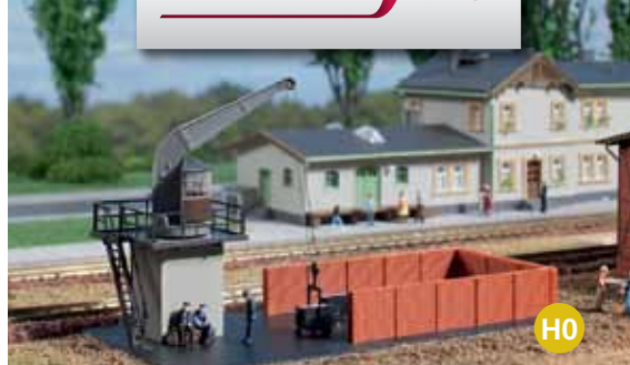
11 445 Bekohlung