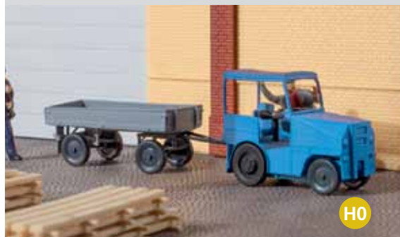
41 636 Kleinschlepper mit Anhänger