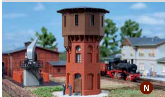
14 476 Wasserturm

Fordern Sie unseren kostenlosen Neuheitenprospekt 2015 an! Den aktuellen Katalog Nr. 13 mit 276 Seiten erhalten Sie im Fachhandel bzw. gegen 7 EUR (Deutschland) inkl. Porto bei: