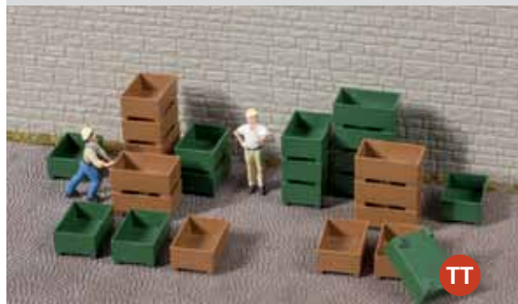
43 657 Transportkisten