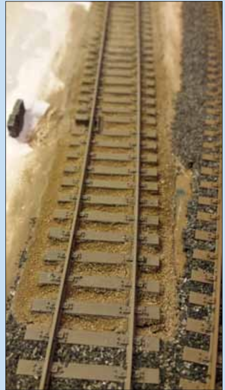
Oben und oben rechts: Während für das durchgehende Streckengleis (im oberen Foto rechts) eine „hohe“ Schotterbettung charakteristisch ist, genügt für das Nebengleis eine vergleichsweise flache Kiesbettung. Deutlich ist die Aussparung für den Bau der Seitenrampe am Gleisende erkennbar.