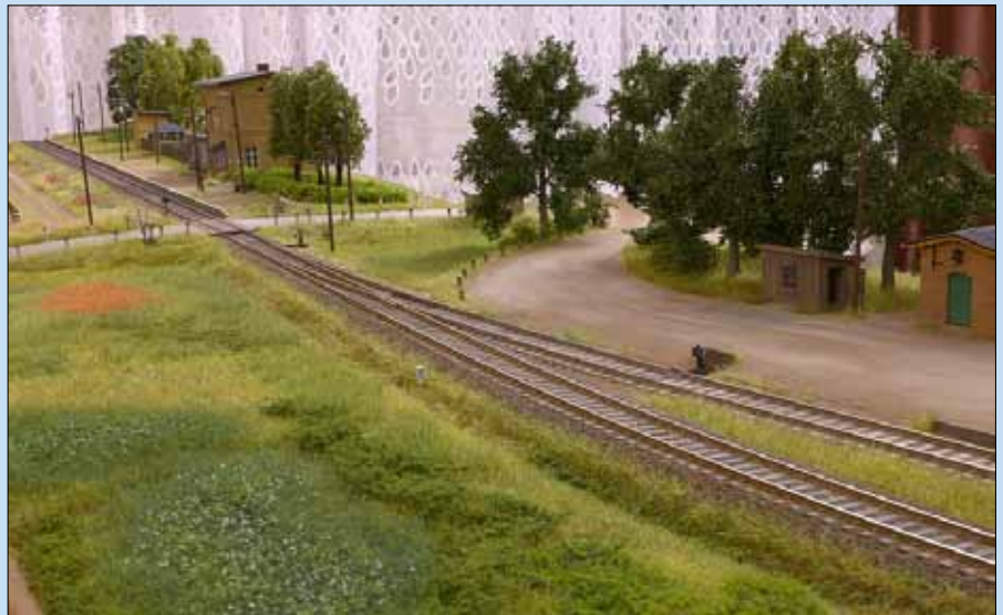
Oben: Unmittelbar hinter dem Bahnübergang am Stationsgebäude beginnt das eingefügte Modul mit der Linksweiche zum Ladegleis. Die Zufahrt zur Ladestraße hinterlässt einen großzügigen Eindruck. Auf vielen Anlagen wird diese Partie oft zu klein und zu eng bemessen.