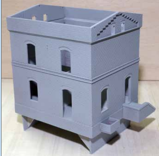
Das gesamte Gebäude in einheitlich grauer Grundierung, die zugleich die Mörtelfarbe in den Fugen des Mauerwerks imitieren soll.

Bei der endgültigen Farbgebung und dem nachfolgenden Abtönen der Ziegelflächen kommt es auf eine flache Pinselführung an, um den Fugeneffekt nicht zu beeinträchtigen.