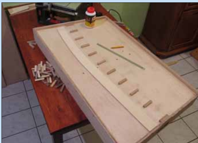
Links: Die Bettung des Streckengleises wurde aus kleinen Querhölzchen mit aufliegendem Trassenbrettchen normgerecht vorbereitet.