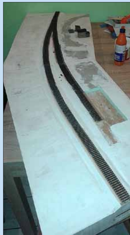
Der optische Vergleich beider Gleise zeigt die unterschiedliche Trassengestaltung des Haupt- und des Nebengleises. Für den Bau der Seitenrampe wurde eine Aussparung im umgebenden Material vorgesehen. Man kann dazu fast alles verwenden, was leicht, stabil und gut zu verarbeiten ist, darunter Styrodur.