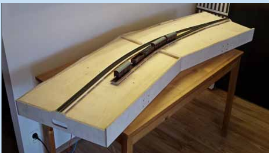
Unten: Die leichte Bogenlage über zwei Module schafft nicht nur eine gewisse Eleganz, sie erhöht vor allem die vorbildgerechte Wirkung.