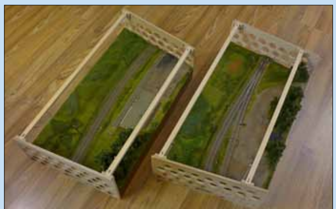
Die beiden Module transportfähig und sicher verschraubt